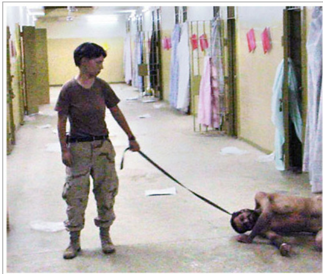
Exclusive to The Washington Post

Tortyren av fångar är det mest bisarra inslaget i Bush maktutövning. Att få fram korrekt information om terroristerna och deras nätverk är av vital betydelse för att kunna bekämpa dem.